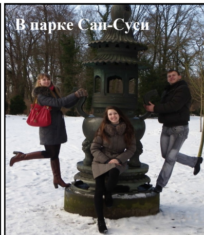
В парке Сан-Сусси