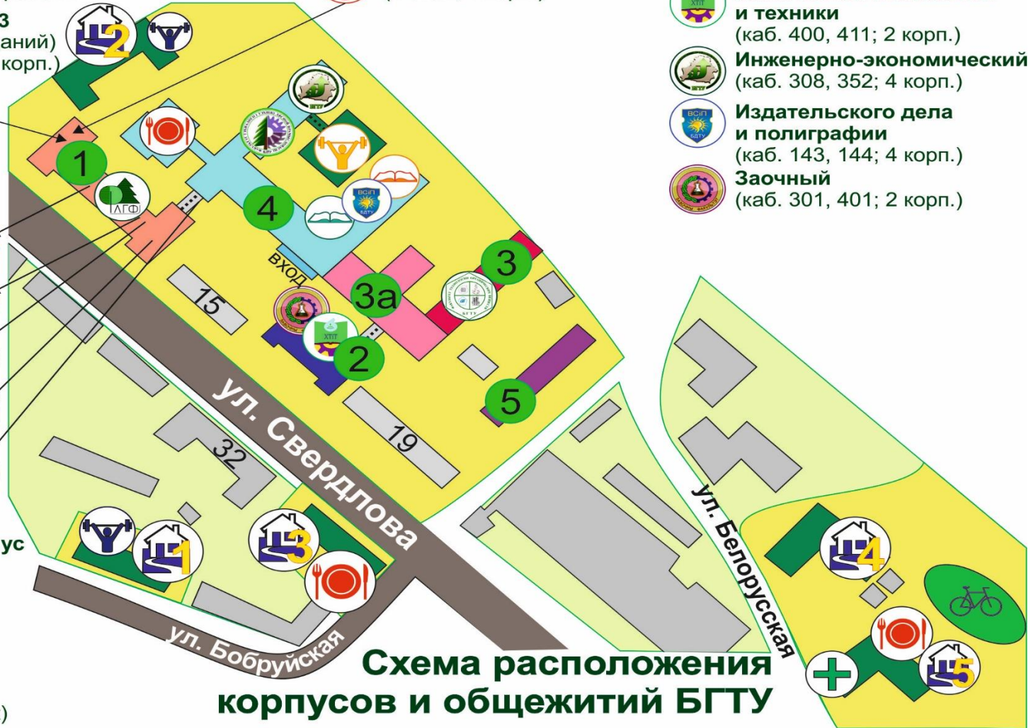
Схема расположения корпусов и общежитий БГТУ